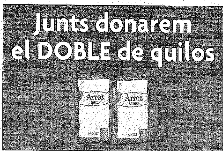
Anunci promocional de la campanya de la Fundació Jacqueline Pradère.